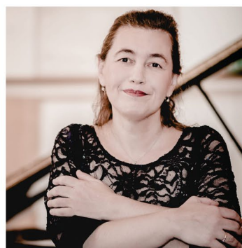
Lilya Zilberstein