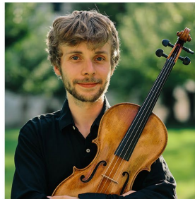
Toby Cook Viola