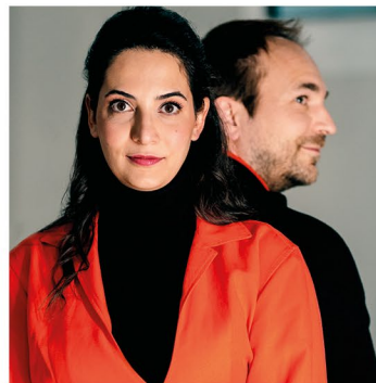
Duo EnsariSchuch