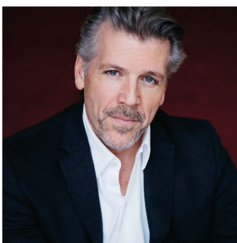
Thomas Hampson