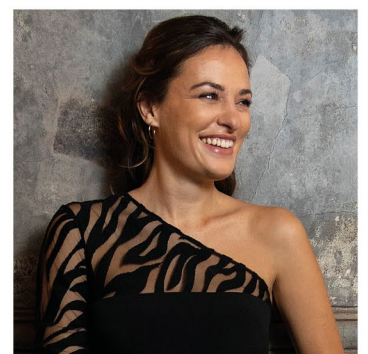
Nicola Benedetti