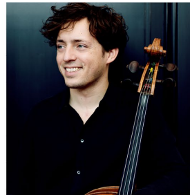
Pieter de Koe Violoncello