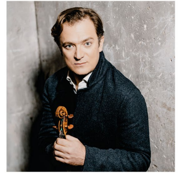
Renaud Capuçon