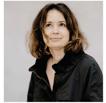
Patricia Kopatchinskaja