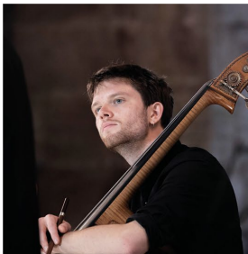
Hans Greve Kontrabass